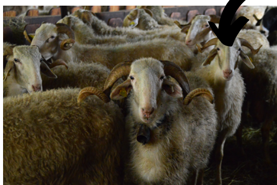
Race : Basco-Béarnaises

"On concentre les brebis sur une zone entre 5 et 10 heures, donc elles amènent beaucoup de matière organique sur cette zone-là. En les déplaçant tous les jours, la matière organique a du temps pour se dégrader, donc la « merde » est déjà décomposée, elle n'a plus d'odeur, ça sent le terreau, et cela donne plus de force au sol. "